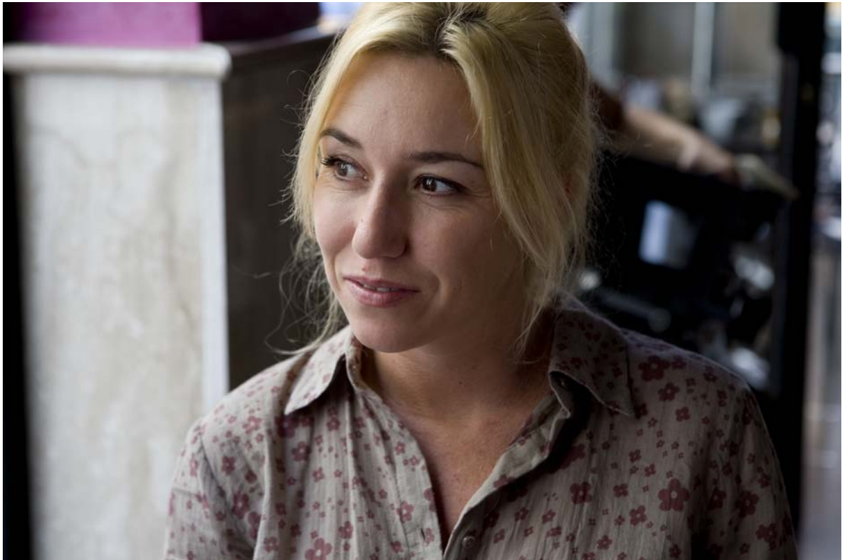
LOLA DUEÑAS ist Laura

und wurde am 6. Oktober 1971 in Barcelona geboren und studierte dort am Institut del Teatre. Vor allem durch zwei Rollen wurde sie weltbekannt: Als Rosa in Das Meer in mir (Mar Adentro) von Alejandro Amenabar, für die sie schon 2004 den Goya als Beste Schauspielerin erhielt; und als Sole in Pedro Almodóvars Volver , für die sie wiederum für den Goya nominiert war.